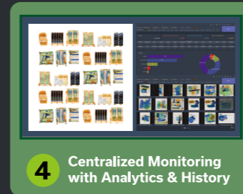
4 Centralized Monitoring with Analytics & History