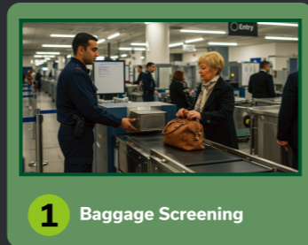
1 Baggage Screening