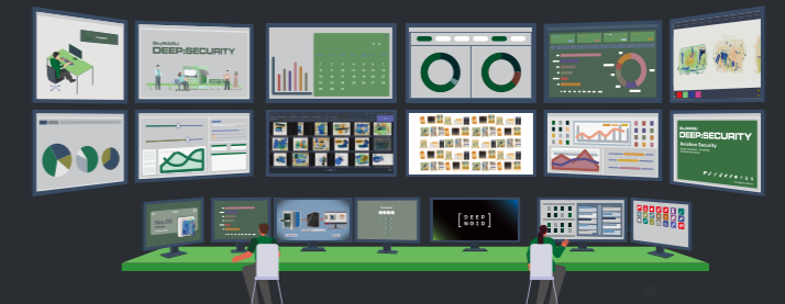
4 Central Data Hub