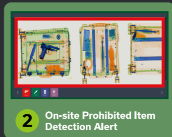
2 On-site Prohibited Item Detection Alert